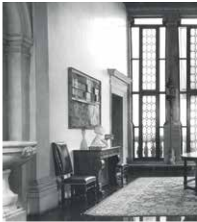
Immagine d'archivio del salone al piano nobile di Palazzo Contarini di Corfù Scamozzi a Venezia prima della vendita di Sotheby's del giugno 2009