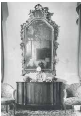
Immagine d'archivio del salotto al piano nobile di Palazzo Contarini di Corfù Scamozzi a Venezia prima della vendita di Sotheby's del giugno 2009